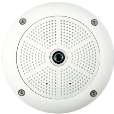
Q24-Standard Ø 160 mm