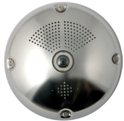
Q24-Antivandalo Ø 160 mm